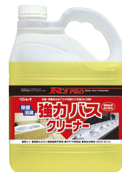
R'S PRO 強力バスクリナー 4L×3本入り [希釈倍率:原液~10倍]