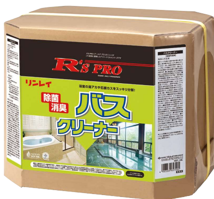
R'S PRO バスクリーナー 18L 【希釈倍率:原液~10倍】