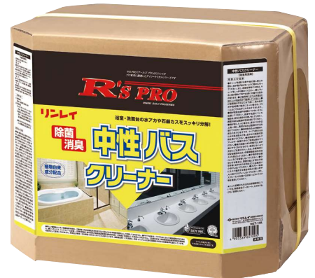
R'S PRO 中性バスクリナー 18L [希釈倍率:原液~10倍]