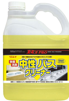
R'S PRO 中性バスクリナー 4L×3本入り [希釈倍率:原液~10倍]