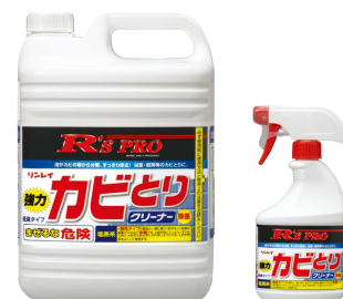
(左)5kg×3本入り 注ぎ口、専用トリガーボトル付き (右)400mL×15本入り